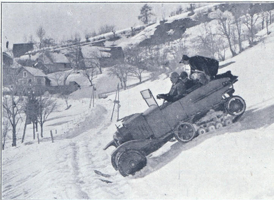
Un automóvil provisto del propulsor Kégresse, se mueve sobre la nieve con cualquier pendiente

Este aparato consta, en líneas generales,