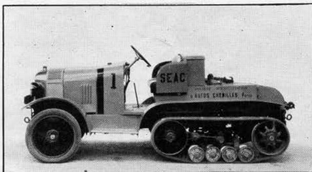
Le nouveau type "Tracteur de Péniche"

Le port de Calais et la Chambre de Commerce de cette ville se réjouissent très vivement du succès rencontré par cette exploitation, qui va naturellement accroître considérablement le mouvement des marchandises par voie d'eau.