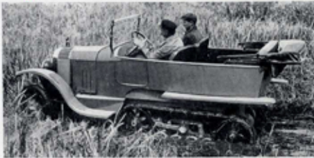
EN PLEIN MARÉCAGE

Les voitures sont livrées avec trousse d'outillage, sans roues de rechange.