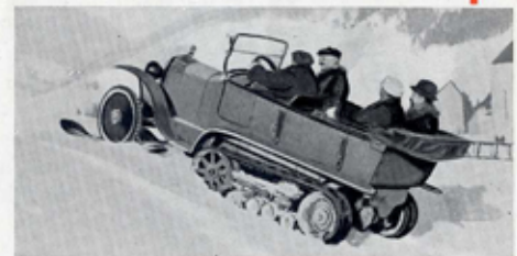
DANS LA NEIGE

CHENILLES DE RECHANGE (modèle "CHEVRON" ou "ÉCHELLE" Chaque. . . 500 fr.