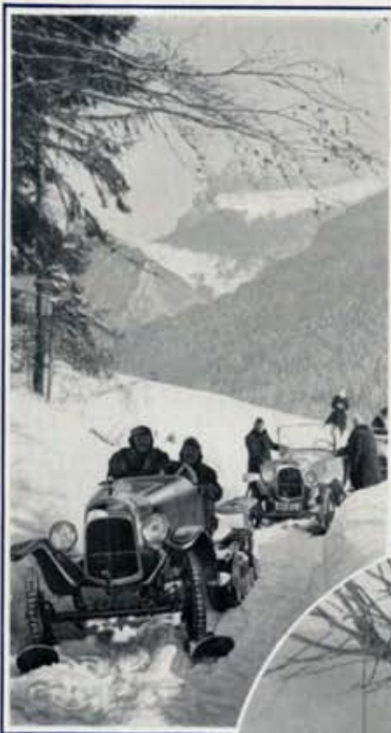
Le Col de Porte.