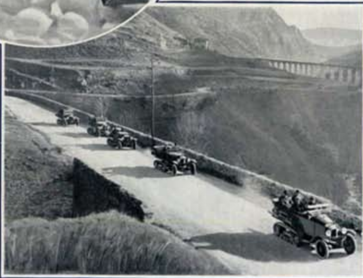
Sur la Route de Montlouis.

Dans la journée les voitures à neige partirent de nouveau pour accomplir des randonnées sur les pentes neigeuses. Certaines réussirent de véritables exploits de tank,