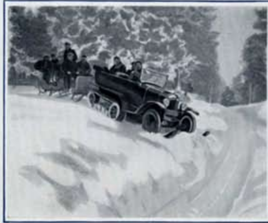
Dans la forêt de Font-Romeu.