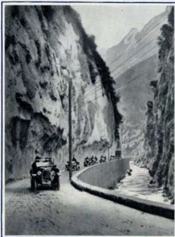
Dans les Gorges de l'Aude.

Il y a quelques jours, me trouvant à déjeuner avec quelques constructeurs français, la conversation vint sur le tracteur Kégresse-Hinstin, aujourd'hui