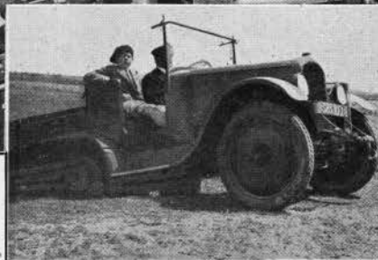
S. A. R. le prince Michel prend place sur un tracteur