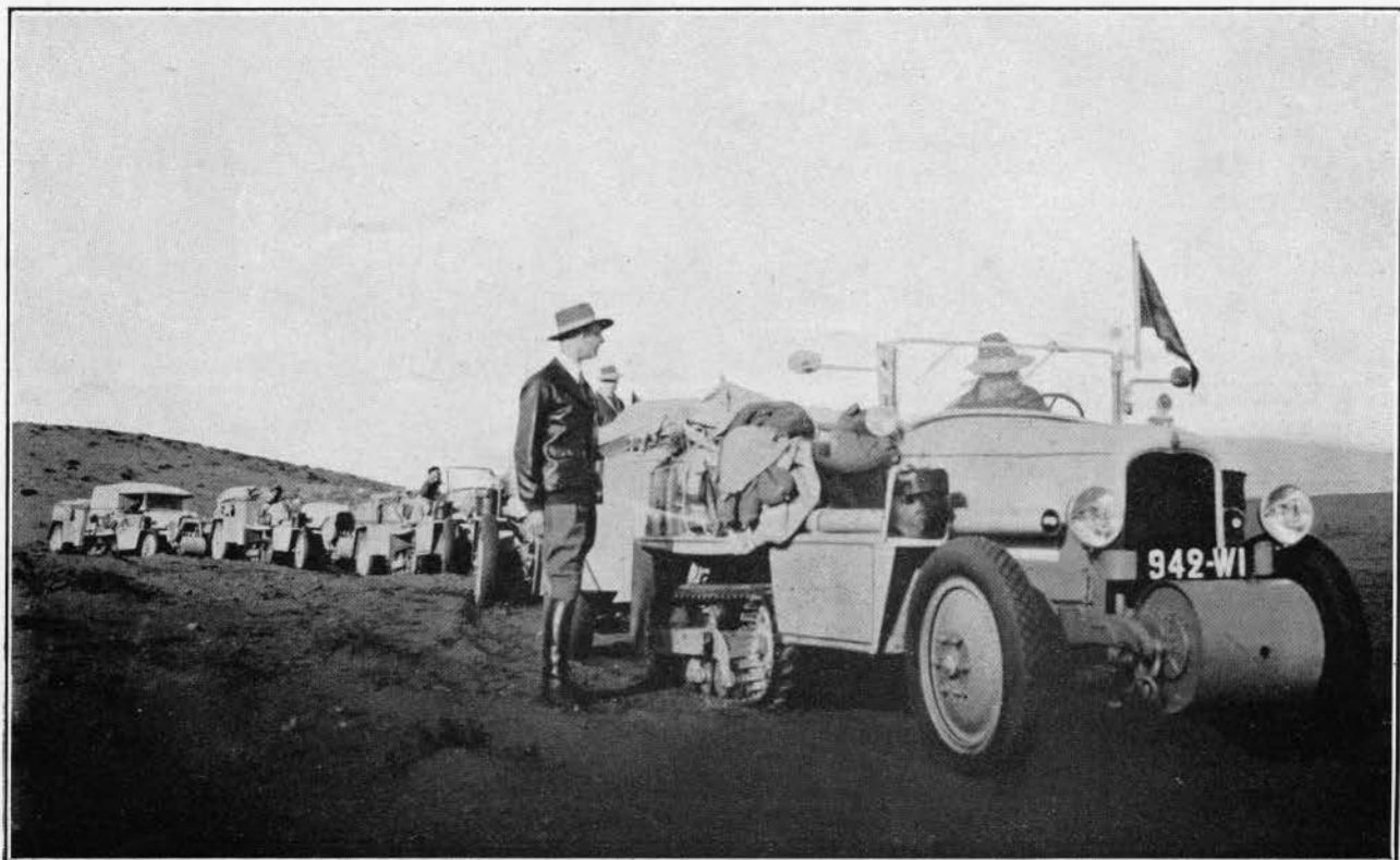
M. G.-M. Haardt, chef de l'Expédition, inspecte le matériel avant d'entreprendre une nouvelle étape.

Vous suivez avec intérêt et fierté les bulletins de marche qui vous arrivent. Aujourd'hui nous avons le plaisir de vous montrer des photographies qui ont été choisies parmi les dernières qui nous sont parvenues. Elles montrent le premier campement et le passage de la Mission devant les vestiges émouvants de l'ancienne civilisation occidentale en Orient.