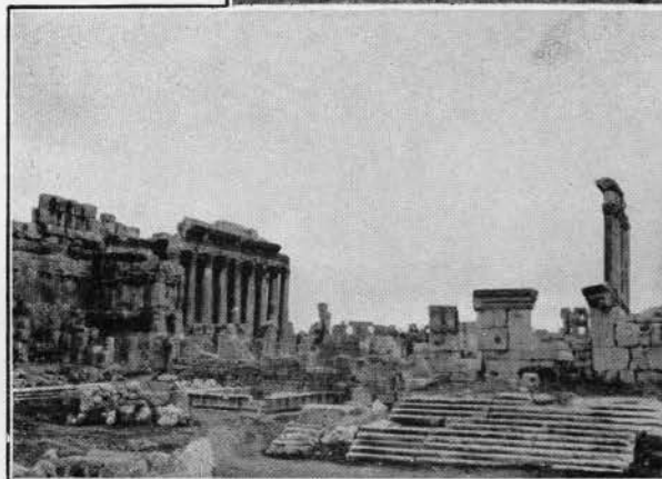
Les ruines de Baalbeck, l'Héliopolis romaine.