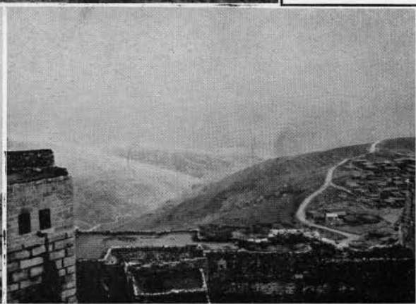
Vue prise du crach des Chevaliers, près de Beyrouth.