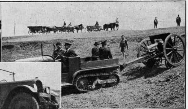
... assiste à des essais d'autochenilles Citroën en terrain varié