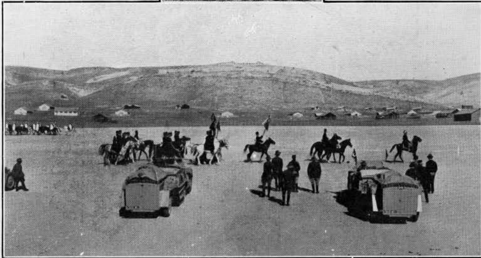
Le défilé des troupes à Damas.

Pamir, le plus formidable obstacle dressé en travers du continent asiatique. On l'a déclaré d'avance infranchissable à la Mission, en dépit des admirables moyens dont elle dispose. En fait, les hommes