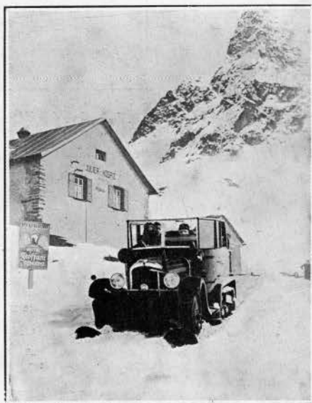
Passage du Col du Julien (2287 m.)