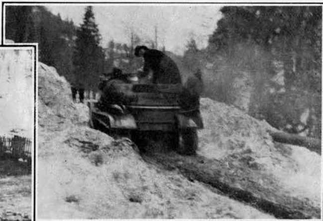
En haut : L'Autochenille passe malgré l'avalanche A gauche : La voiture couronnée de feuillages par les habitants