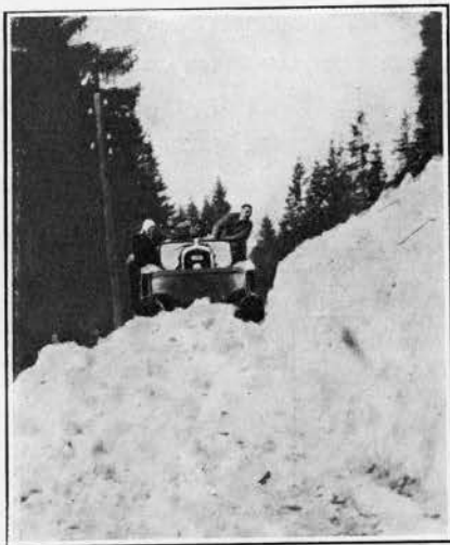
Dans le Tyrol à travers les éboulis

L'article qu'on va lire ci-après est l'écho des intéressantes démonstrations qui furent faites cet hiver aux environs de Chamonix et de Saint-Moritz par nos nouvelles voitures à chenilles. Les indiscutables qualités dont elles firent preuve ont attiré l'attention sur leurs facultés d'utilisation qui dépassent de beaucoup le cadre du tourisme sportif. De nombreuses commandes ont été ainsi enregistrées par notre département d'autochenilles. Nos agents français de certaines régions trouveront une occasion d'élargir leurs débouchés en recherchant la vente des voitures-neige C-6. Leurs conditions d'exploitation sont des plus étendues et il existe pour ces voitures un large marché.