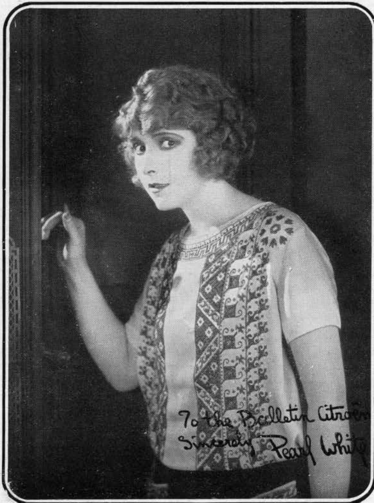
Miss PEARL WHITE, la grande étoile mondiale de l'écran.

Empruntant, pour se lancer à la poursuite