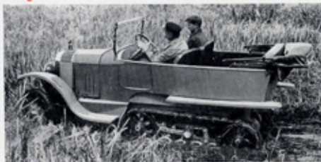
EN PLEIN MARÉCAGE

Les voitures sont livrées avec trousse d'outillage, sans roues de rechange.