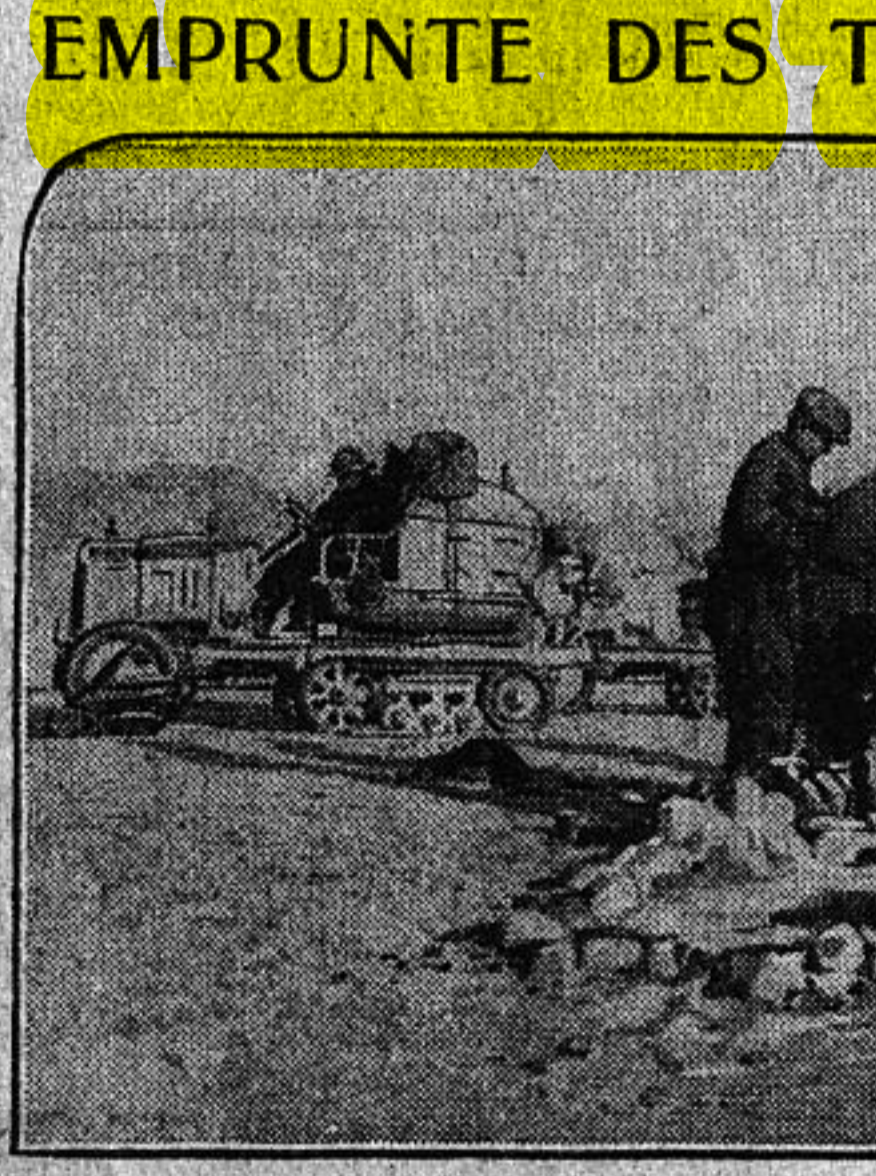
Les essais préliminaires des voitures Citroën à chenilles Kégresse-Hinstin avaient eu lieu au début de cette année sur le parcours Ouargla-Inifel-Sahara. Voici la photographie de la caravane se ravitaillant en eau à l'un des puits, situés entre Ouargla et Inifel.