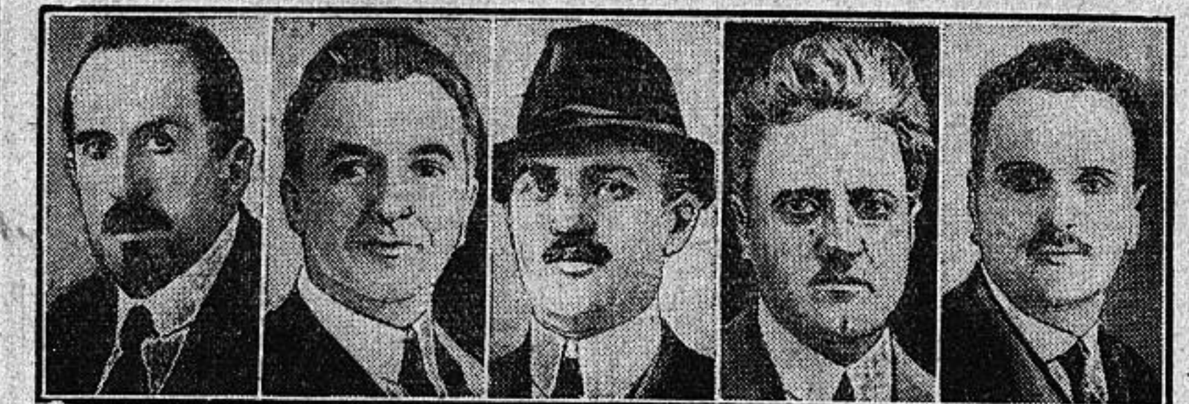
QUELQUES MEMBRES DU CABINET MUSSOLINI. De gauche à droite: MM. GIURIATI, FEDERZONI, VASSALLO, DE STEFANI, OVIOLIO

L'ambassadeur d'Italie à Paris se déclare en désaccord avec la politique extérieure du nouveau gouvernement