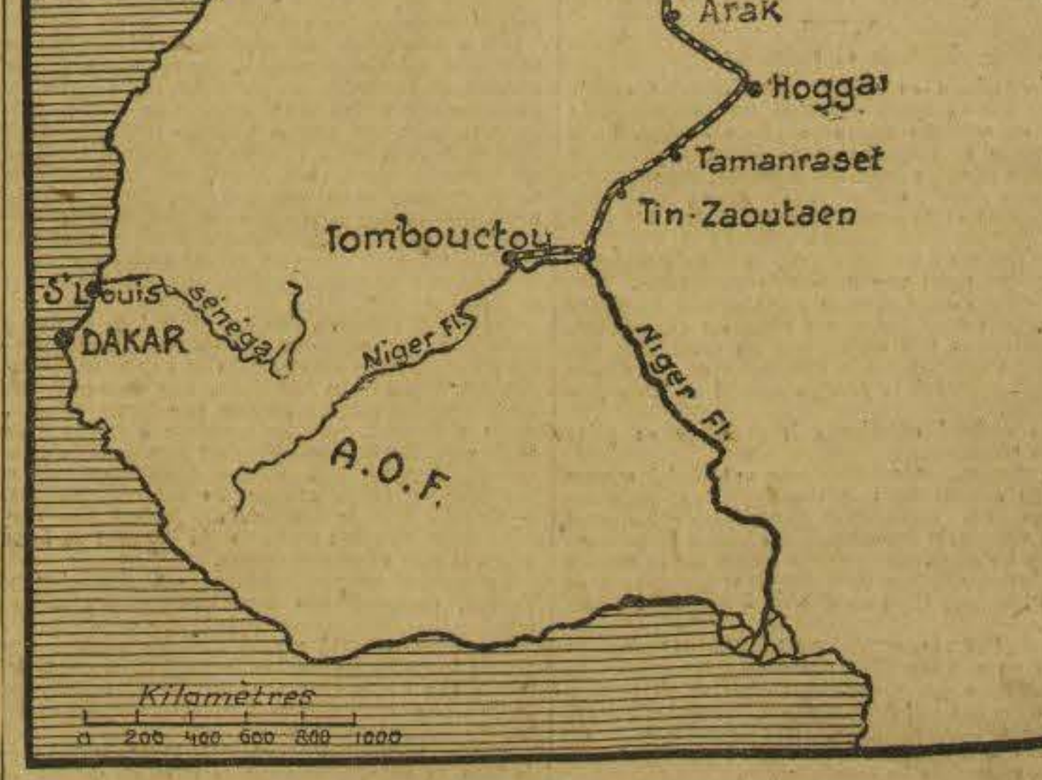
L'itinéraire de la traversée du Sahara jusqu'à Tombouctou.

Le matériel Le matériel de la mission comporte cinq voitures dont les châssis sont semblables, mais dont les aménagements varient. Ces châssis sont du type 10 HP, Citroën ; le moteur est identique à ceux