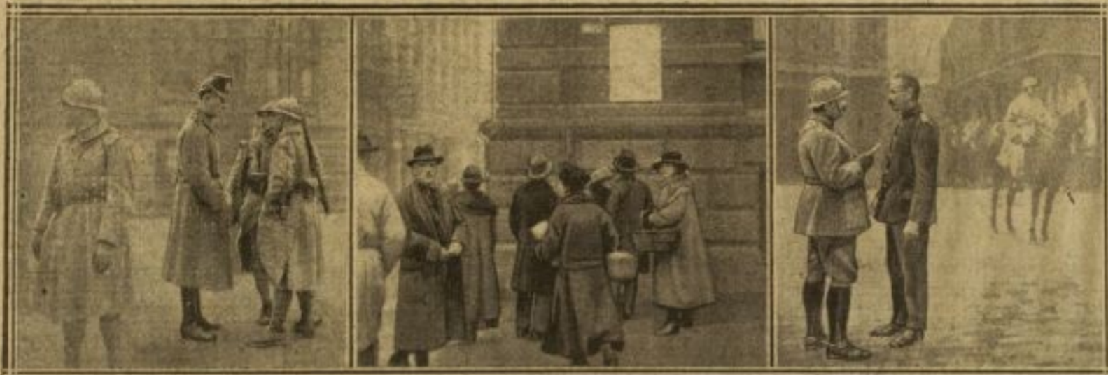
ENTRETIEN AVEC UN AGENT DE LA POLICE VERTE — LA LECTURE D'UNE AFFICHE DEVANT LES USINES — UN EMPLOYÉ DE LA CHANCELLERIE REÇOIT DES ORDRES