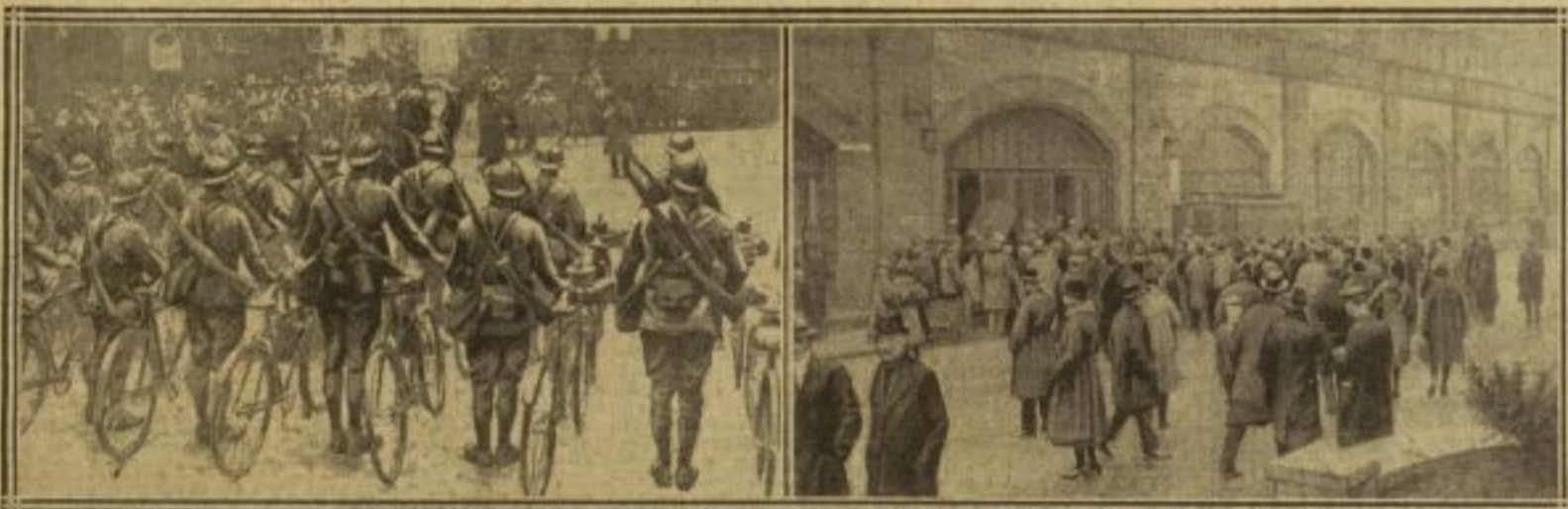
UNE COMPAGNIE DE CYCLISTES DEVANT LE MONUMENT DE KRUPP