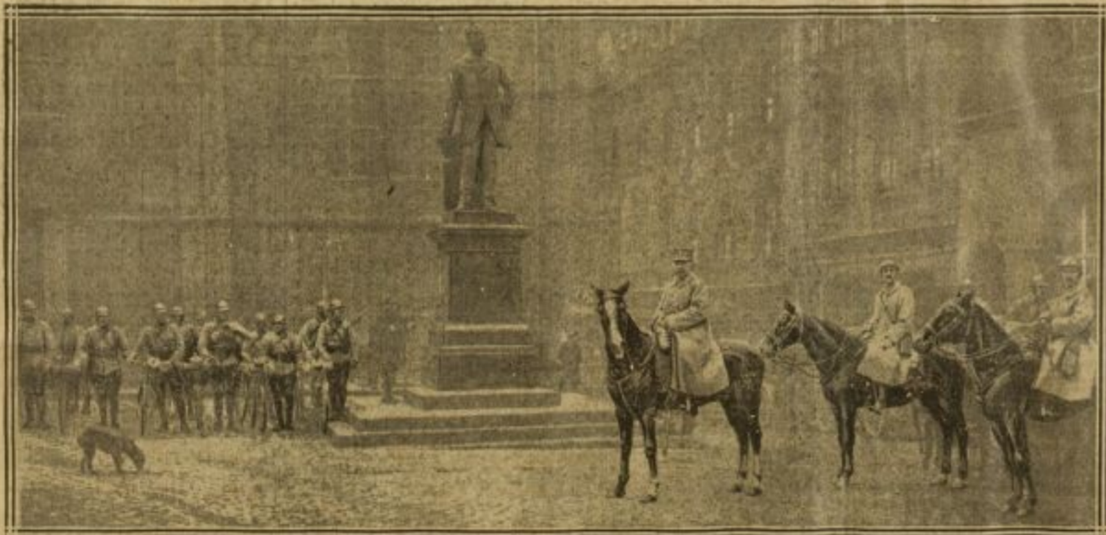
LE COMMANDEMENT FRANÇAIS DEVANT L'HOTEL DE VILLE D'ESSEN. AU FOND, LE MONUMENT D'ALFRED KRUPP

L'organisation Hitler, qui est un groupement d'étudiants nationalistes, a délégué dans la Ruhr quelques-uns de ses représentants les plus déterminés, dont la plupart se sont embauchés en qualité d'ouvriers dans les mines pour y faire de la propagande. Ces jeunes gens n'ont réussi qu'à provoquer une effervescence de quelques heures, la foule chantant des hymnes patriotiques. Tout rentra bientôt dans l'ordre. La population se montre curieuse des faits et gestes de nos soldats et forme des groupes devant les postes disséminés dans la ville.