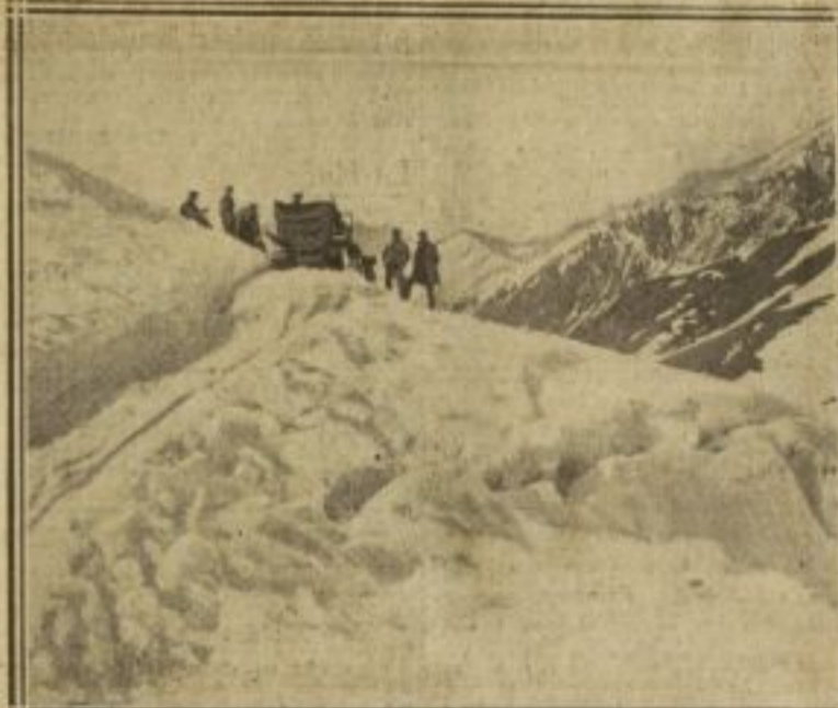
L'AUTOCHENILLE ARRÊTÉE, L'AN DERNIER, AVANT LE COL DU TOURMALET

La semaine qui vient devait voir, en autochenille, la traversée du Tourmalet, qu'une trop grande abondance de neige interrompit l'an dernier. Bien que des précautions aient été prises, il est à craindre que la tempête de neige qui sévit rende encore la traversée impossible.