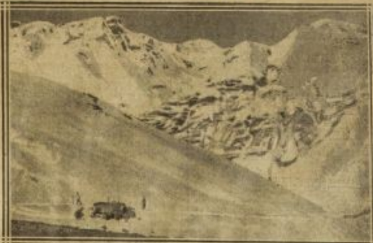
VUE GÉNÉRALE DU MASSIF DU TOURMALET, DANS LES PYRÉNÉES