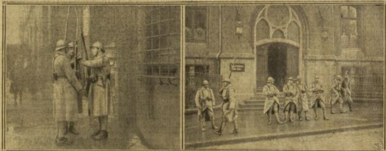
LA RELEVÉ D'UN FACTIONNAIRE FRANÇAIS