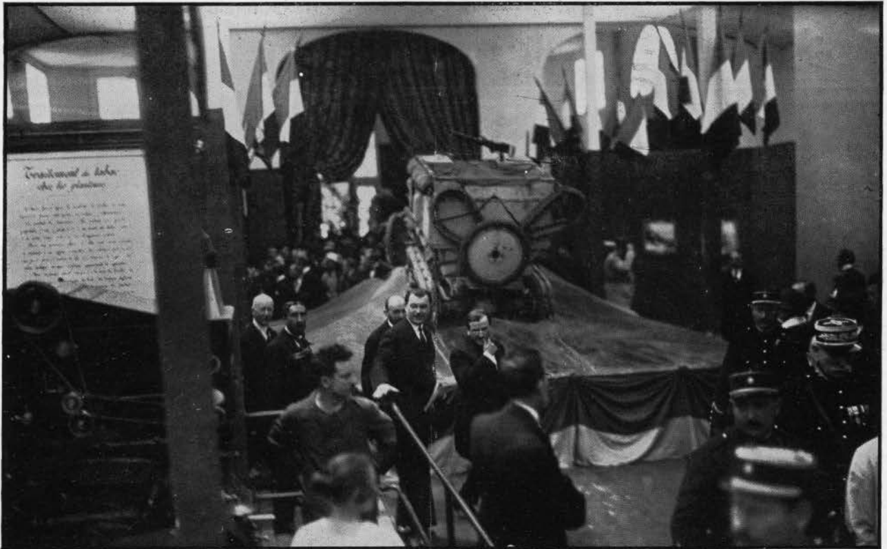
Le Ministre des Colonies inaugure l'Exposition Coloniale.

Notre photographie de couverture reproduit l'autochenille telle qu'elle est présentée à Strasbourg ; elle est montée sur un socle représentant une dune de sable et faisant bien com-