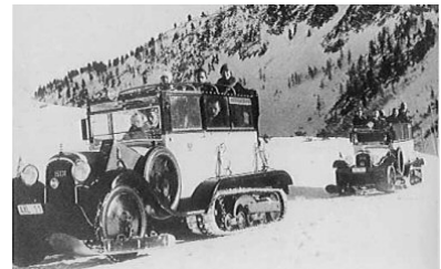
1939, version courte vers le Tauern