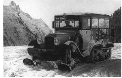
BP 1266 , version longue

Contrairement aux modèles courts, les versions longues peuvent être équipées de roues comme le prouve la forme des ailes arrière (arche au centre).