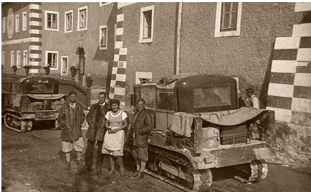
BP 1263 , version courte

A une époque où les remontées mécaniques n'existent pas encore, ces bus permettent de mener les skieurs en haut des pentes.