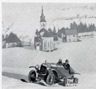
ASCENSION DU COL DE LA GRANDE CHARTREUSE