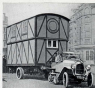
REMORQUAGE D'UNE MAISON ROULANTE DE 3 TONNES ½