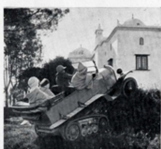
ASCENSION D'UNE PENTE DE 80 %