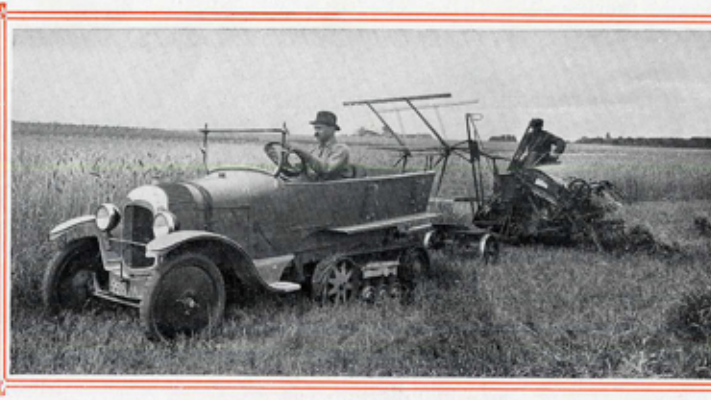
LA MOISSON EN BAUCE