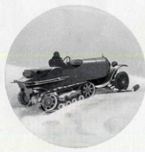
EN PLEIN DÉSERT DE NEIGE