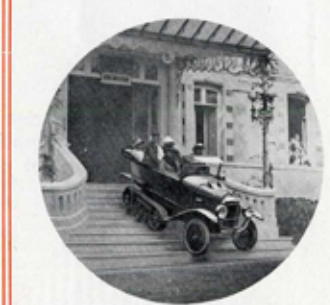
UNE SORTIE SENSATIONNELLE

ANDRÉ CITROËN, Ingénieur-Constructeur, 115-143, Quai de Javel, Paris. — Département KÉGRESSE, Rue Balard.