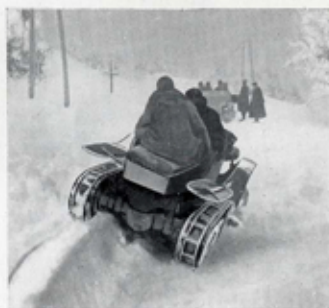
DANS LA NEIGE VIERGE DU COL DU GRANIER