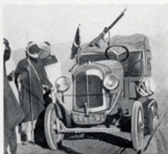
AU CŒUR DU DÉSERT