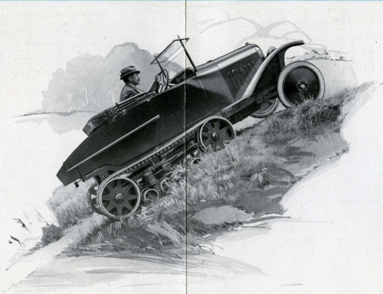
VOITURE "TOUS TERRAINS"

Complète, avec carrosserie camionnette et à 4 places, système de blocage facultatif du différentiel, réducteur de vitesse commandé, direction par les chenilles combinée avec les roues AV, crochet d'attelage pour remorque.