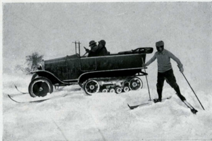
" VOITURE A NEIGE "

Complète, avec carrosserie camionnette et à 4 places, Skis pour les roues AV, système de blocage facultatif du différentiel, réducteur de vitesse commandé, direction par les chenilles combinée avec les roues AV, crochet d'attelage pour remorque.